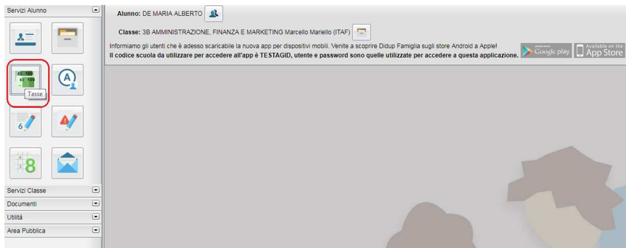
(accesso ai servizi di pagamento)

Il servizio di pagamento delle tasse e dei contributi scolastici è integrato all'interno di Scuolanext - Famiglia, ed è richiamabile tramite il menù dei Servizi dell'Alunno .